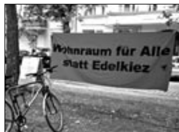
BEZAHLBARE MIETEN für alle, wird im Kiez gefordert

in die neuen Ghettos Marzahn, Alt Mariendorf und ins Falkenhagener Feld in Spandau. Eine andere Auswirkung sind zunehmende Klagen Umzugsunwilliger am Sozialgericht, denn da das Jobcenter keine Richtlinie hat, entscheidet der Richter im Einzelfall, ob die Höhe der Miete des Klägers vom Jobcenter übernommen wird oder nicht. Mitgefühl entsteht für die so wieso schon überlasteten Richter. Sie hätten tatsächlich Wichtigeres zu tun. oj