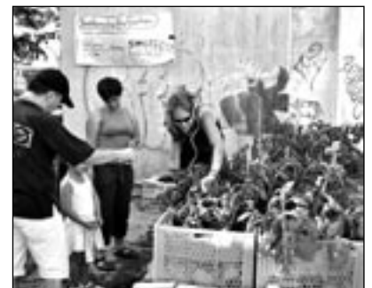
FLEISSIGE HÄNDE gestalten den Nachbarschaftsgarten

Badewannen wachsen Gurken und Kürbisse, selbst Einkaufswagen werden zu Pflanzgefäßen. Gegossen wird an diesen warmen Tagen mindestens einmal am Tag. Die Hobbygärtner haben sich schlaue gemacht und wissen inzwischen, welche Pflege sie den Pflanzen angedeihen lassen müssen, um dann eine reiche Ernte zu erwirtschaften, und die Kinder aus der Nachbarschaft sehen hier vielleicht zum