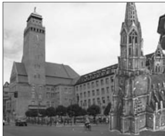
DEMNÄCHST IN NEUKÖLLN – Damit Zugezogene sich Zuhause fühlen.

Kleine Nachhilfe für Neu-Berliner: Meckern von Berlinern = Gesprächsangebot