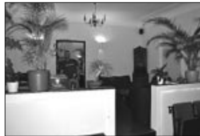
MAL SO – für Nichtraucher gibt es Wohnzimmeratmosphäre.

Böhmisches Straße 14 12055 Berlin Di – So: 12:00 bis 22:00 oder länger, eben mal so, mal so, Mo: geschlossen