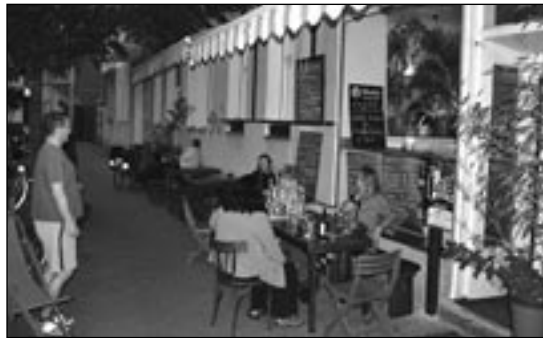
MAL SO – Raucher findet man an den gemütlichen Tischen vor dem Lokal