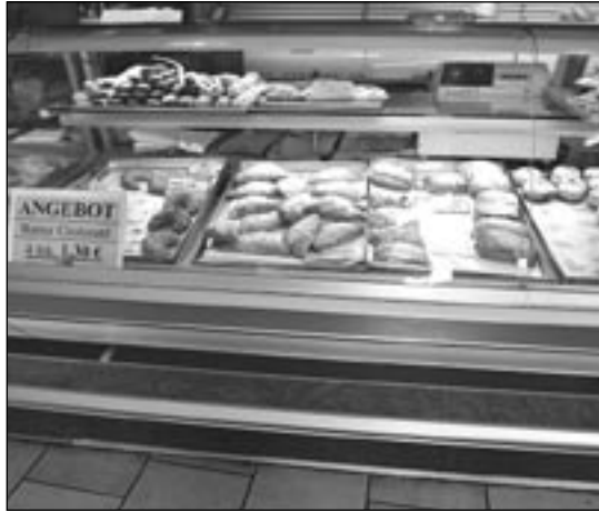
DIE AUSLAGE in einer Bäckerei kann zu detaillierten Fragen führen.

Das hätte sie natürlich nicht sagen sollen, weil