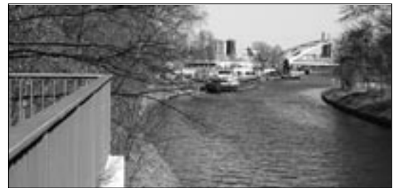
TELLOWKANAL Kühlmittel verunreinigten den Kanal, Strafermittlungen sind eingeleitet.