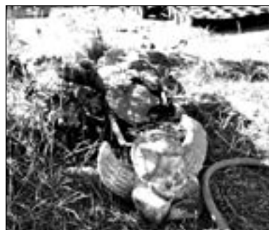
PUTTEN erhalten eine neue Aufgabe

An der Kienitzer Straße Ecke Bornsdorfer Straße gibt es ein solches