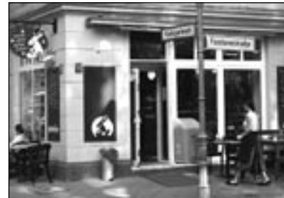
CAFÉ BLUME Tee und Kuchen an der Hasenheide

Aber nicht nur Familien mit Kindern nehmen dieses neue Lokal dankbar an. Auch die Lehrer der schräg gegenüber liegenden Karlsgarten