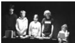
LESUNG »Luna Park«

scheinbar angenehmen Ort, dass Unterhaltung der seichten Art auch nicht glücklich macht. Und sie erleben, dass sie auch hier gefangen und sehr subtilen Manipulationen ausgesetzt sind. Schnell erkennen sie, dass sie sich in einer Parallelwelt befinden, deren