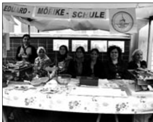
VIELE MÜTTER waren dabei als es darum ging Internationale Suppen zu kochen und zu verteilen

Bezirksbürgermeister Buschkowsky rief bei seiner Eröffnungsrede dazu auf, miteinander zu arbeiten, um den Kiez lebenswert zu erhalten. »Quartiersmanagement ist nur ein Fremdwort für Bürgerbeteiligung.«