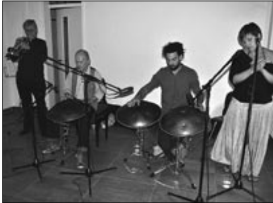
DAS HANG – Ein im Jahre 2000 in der Schweiz erfundenes Musikinstrument.

eine außergewöhnliche Klangvielfalt verfügt. Das reicht von sphärischen Klängen, die an