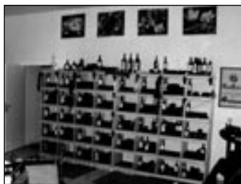
VIELE FLASCHEN – gute Tropfen im Weinsteil

fensterscheibe. Reinhold Greinke fühlte sich bedroht und reagierte. In einem Brief (siehe Kasten) an die Übeltäter stellte er klar, dass er nichts mit Gentrifizierung zu tun hat, er auch niemanden verdrängen will und aus Arbeitslo-