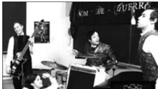
NOM DE GUERRE Heroes Block Party Friedelstr. 49, 21:00

vielen Plätzen und Bühnen der Stadt wird musiziert, was das Zeug hält, ohne dass sich Nachbarn beschweren können oder die Ordnungshüter einschreiten. Das musikalische Spektrum ist sehr groß, es gibt kaum einen Stil, der nicht präsent ist. Jeder, vom Hobbymusiker bis zum Profi, kann auftreten. Da es jedoch keine Gage gibt, überwiegt die Zahl der Amateurmusiker. Doch auch für Profis kann es interessant sein, wenn sie ihre CD oder ihre Band promoten wollen.