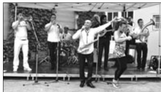
FANFARA KALASHNIKOV Balkanbrass bis Heavy Metal.

der die Band vorantrieb. Ihr Repertoire ist wesentlich breiter als das der meisten Balkanbands. Da kommen auch schon mal Heavy-