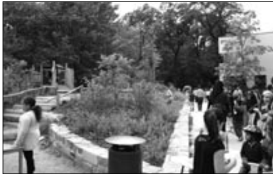
SCHULHOFLANDSCHAFT – neue Pausenerfahrungen für Grundschüler

schaftsarchitektur übernahm hierbei die Planung und Bauleitung dieser wunderschönen, ökologischen Spiellandschaft.