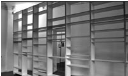
BILLY, das Regalsystem für Generationen, Synonym für Freiheit, Gleichheit, Belanglosigkeit.