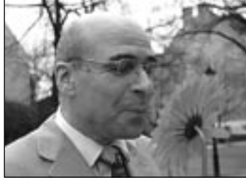
DIE GERBERA bekannt seit 1735.

eine Blume wäre. Sie hatten keine Ahnung, doch lagen sie richtig mit ihrer Feststellung »eine Rose ist das nicht«.