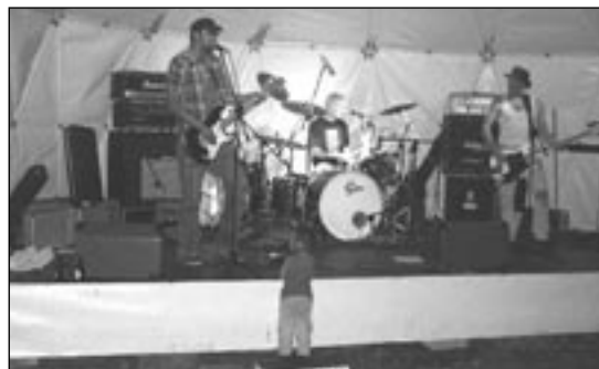
BASTADO FOUR – Dilemma Reuterstr. 23, 19:00

in 340 Städten weltweit. In Berlin, wo die Fête seit 1995 stattfindet, wird sie von der Senatskanzlei für Kul-