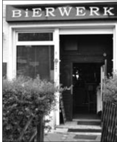
AM KRANOLDPLATZ – Kranoldstraße 1

Hier findet am ersten Sonntag im Monat eine Fischbörse statt. Aquarien werden aus dem Lager