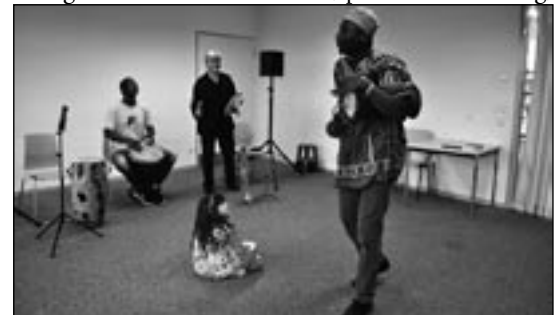
BABA DANGO TRIO in der Helene Nathan Bibliothek.

Die Musik, die dieses Trio spielt, ist rhythmisch, fröhlich, ausgelassen, pulsierend lebendig,