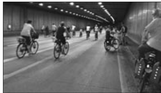
DEMO im Britzer Tunnel.

Die Autofahrer hatten an diesem Tag das Nachsehen, weil fast alle Hauptverkehrsstraßen zumindest teilweise gesperrt waren. Wo sich normalerweise der Autoverkehr staut, waren nun Fahrradstaus unter brennender Sonne zu ertragen. Da wurde gar manchem schwindelig oder übel. Die fahrradfahrende Musik konnte da auch nicht helfen. Insgesamt gab es bei der Veranstaltung aber keine Zwischenfälle bis auf einige wenige Autofahrer, die über die Sperrungen nicht erfreut waren und ihr Auto durch den Fahrradpulk steuern wollten. mr