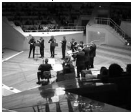
STRADIVARIS im Einsatz.

Mit dieser Entscheidung ist für die ungefähr 100 Rollbergkinder, die von der Schülerhilfe profitieren, für dieses Jahr der ehrenamtlich durchgeführte und ausgesprochen erfolgreiche Nachhilfeunterricht gesichert.