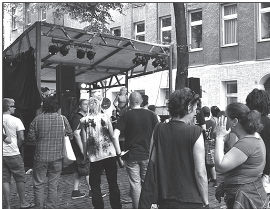
MUSIK sorgte für Unterhaltung.