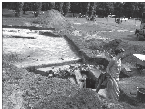
AUSGRABUNG von Baracken auf dem Tempelhofer Feld.

Zwischen dem jetzigen Flughafengebäude und dem ehemaligen Garnitionsfriedhof gab es etwa