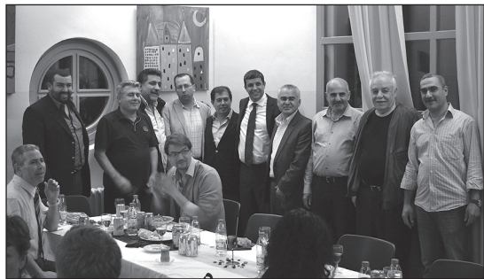
VERTRETER aus Wirtschaft und Politik.

lich sich die Grundsätze des Koran und des christlichen Glaubens hinsichtlich der Fastenzeit sind: Bescheidenheit, Demut, Nachdenklichkeit und Verzicht auf etliche Genüsse während dieser Zeit sind die Regeln. Nach dem arabi-