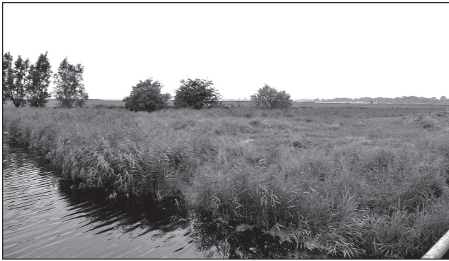
WEITES flaches Freisland.