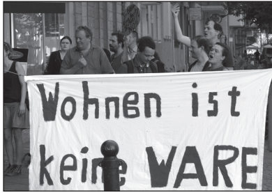
AUF nach Charlottenburg.

Unter den Besuchern waren etliche, die durch Ziegerts Firmenphilosophie ihre Mietwohnungen verloren haben oder denen dies bevorsteht. Als einige der Besucher mit Entscheidungsträgern der Immobilienfirma sprechen wollten, gingen in den Büros die Jalousien herunter - auch eine Antwort.