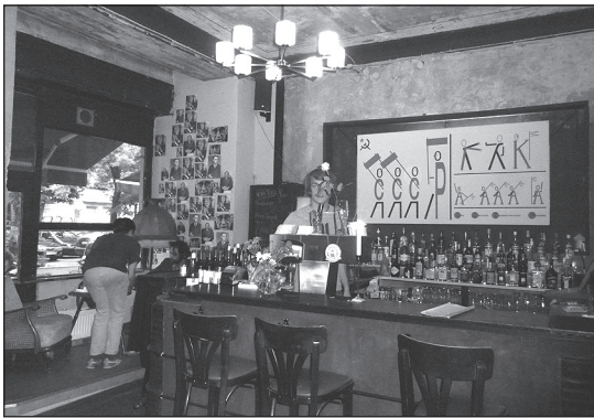
KINDL STUBEN – gute Stube ohne Kindl.

straße ist und wahrlich auch nicht werden muss – mehr von solchen angenehmen und aufgeschlossenen Allround-Lokalen kann sie durchaus noch vertragen. hlb Kindl Stuben, Sonnenallee 92 Tgl. 10 – mind. 2 Uhr