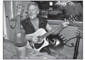
UKULELE im Glas.

einem Ukulelen Flohmarkt. Von 13-17 Uhr gibt es stündlich wechselnde Workshops, danach eine Tombola mit dem Hauptpreis – was sonst – einer Ukulele und als weitere Preise Ukulele-Zubehör. Ab 19