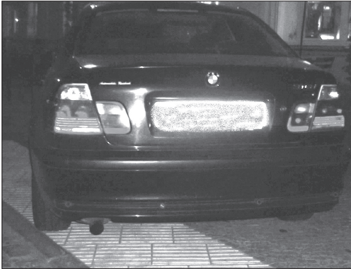
AUCH Blindensteine werden zugesperrt.

Es gibt kein Recht auf einen Parkplatz vor der eigenen Wohnung, kleinere Fußwege, vom Parkplatz zur Wohnung, sollten in Zukunft bei Fahrten mit dem Auto eingeplant werden.