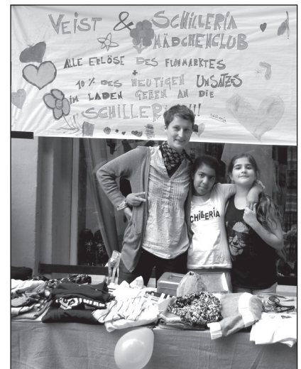
VOR dem Veist.

Alles in allem war der Tag für alle eine gelungene Idee. »Das können wir gerne wiederholen«, hieß es von beiden Seiten. Beim Wort »Aufräumen« waren die Jüngsten dann aber ganz schnell