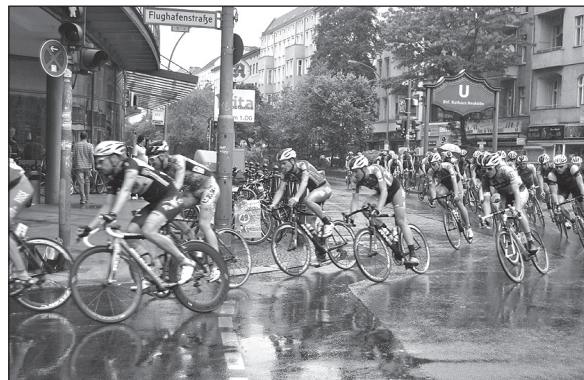
HARTER Kampf in nassen Kurven.

Auch für die Rennfahrer war der Regen, der zwar für etwas Abkühlung sorgte, unangenehm und es kam zu einigen Stürzen. Diese endeten zum Glück glimpflich. Ärgerlich war das Verhalten einiger Passanten, die mit ihrem Rad auf der Strecke unterwegs waren, das Rennen völlig ignorierten und die Rennfahrer gefährdeten. In Zukunft wäre zu überlegen, ob die Streckenführung nicht geändert werden sollte. Vielleicht könnte das Rennen auf dem Tempelhofer Feld stattfinden. Da gäbe es weniger Beeinträchtigungen und sicher mehr Zuschauer.