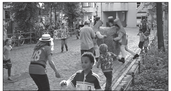
AUCH für Kinder wird viel geboten.

Die Festveranstalter wendeten sich mit dem gleichen Antrag an das QM Ganghoferstraße, und auch mit der Info über die Nichtvorlage im QM Richardplatz-Süd. Hier wurde der Antrag der Vergabjury vorgelegt und ohne Abstriche