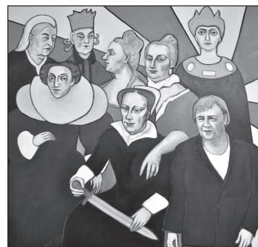
KÖNIGINNEN unter sich.

Seite stellt. So wirkt Angela Merkel selbstsicher