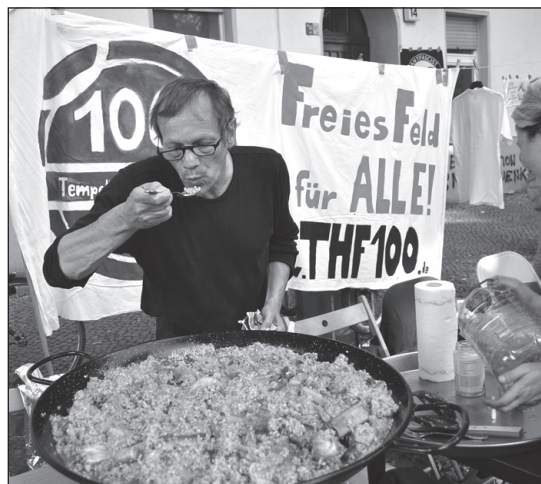
TEMPELHOF 100 kocht.