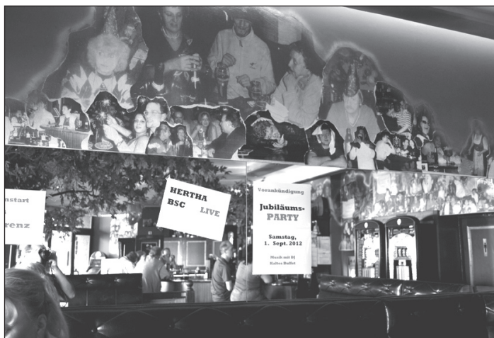
PARTY an allen Wänden.

Zwei Dartautomaten fordern zum Spiel auf, ein Billardtisch steht im separaten Raum. Auf