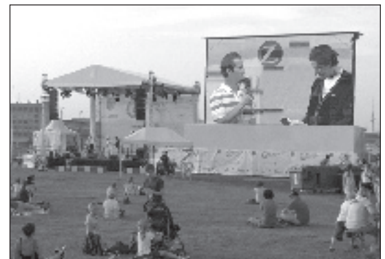
OLYMPISCHES FELD: Auf dem ehemaligen Flughafen gibt's nicht nur Public Viewing.

Den Höhepunkt der »Spiele in Berlin« bildete die Verabschiedung von rund 50 Sportlern der deutschen Paralympischen Mannschaft zu den Paralympics in London 2012. cal