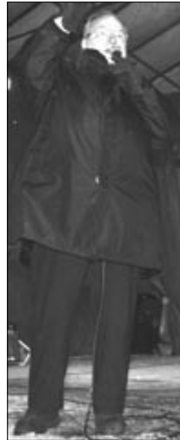
BÜRGERMEISTER in Aktion.

tungen sind in Neukölln bereits in vollem Gange.