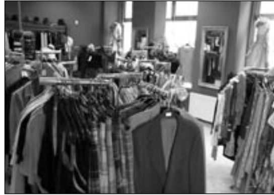
SECOND-HAND-LÄDEN machen gute Laune, findet Kiki.

angebotenen Accessoires, interessieren Kiki jedoch wenig. Ihr hat es das ge-