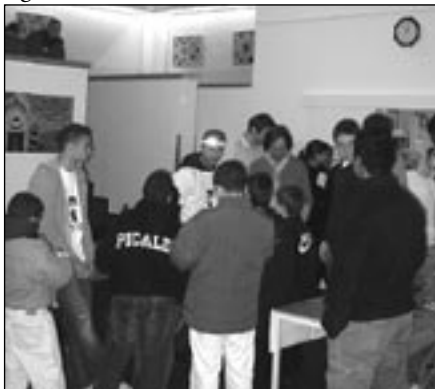
HERTHANACHWUCHS beim Mittagessen.

hen monatlich auf dem Programm, und nicht zu unterschätzen ist die Schülerhilfe, die vielen Rollberger Kindern