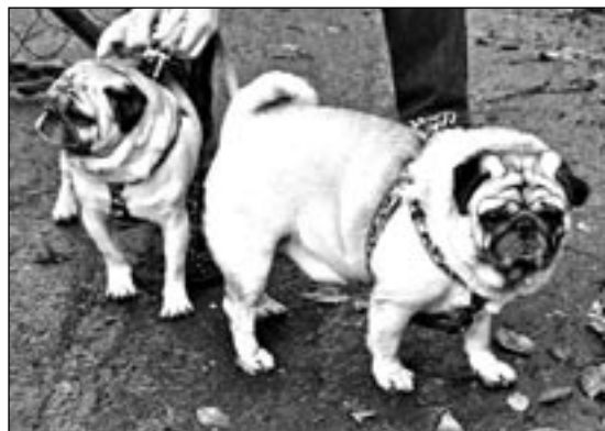
WIR DÜRFEN hier drauf. Wir sind niedriger als 35cm.