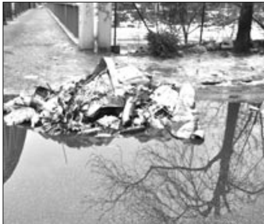
RESTMÜLL – auch dieser wurde bald beseitigt.

liegen an den Straßenrändern herum. Es war auch gerade erst Weihnachten