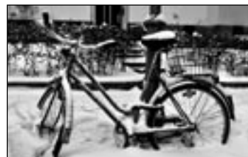
FAHRRAD festgefroren.

Doch der Umschwung hat auch seine Nachteile.