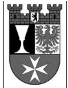
DAS NEUKÖLLNER WAPPEN.